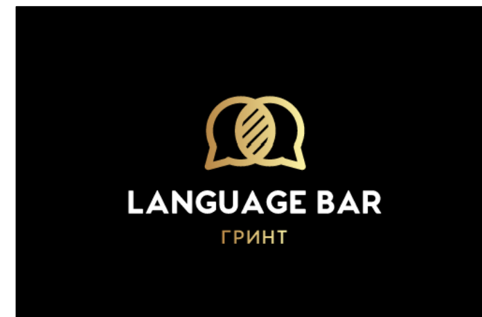
Изучение иностранных языков