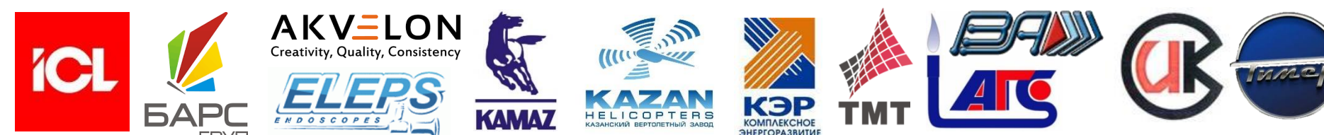
Работодатели и партнеры