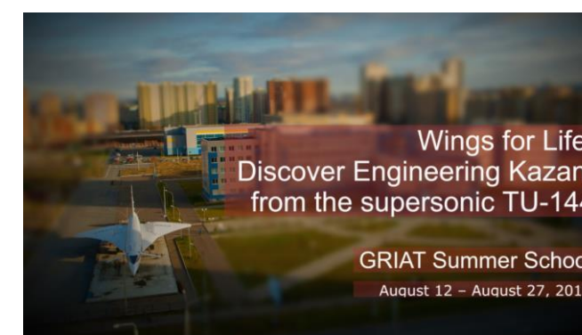
Летняя школа 2018