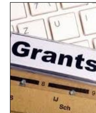
Заявки на гранты