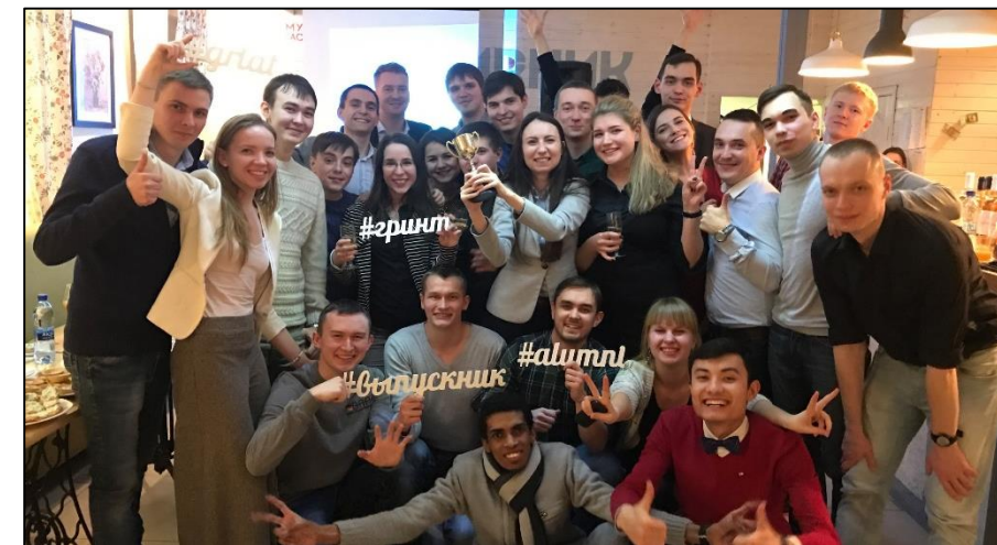
Встреча выпускников 2016

Канал телеграмм – единственный источник коммуникаций